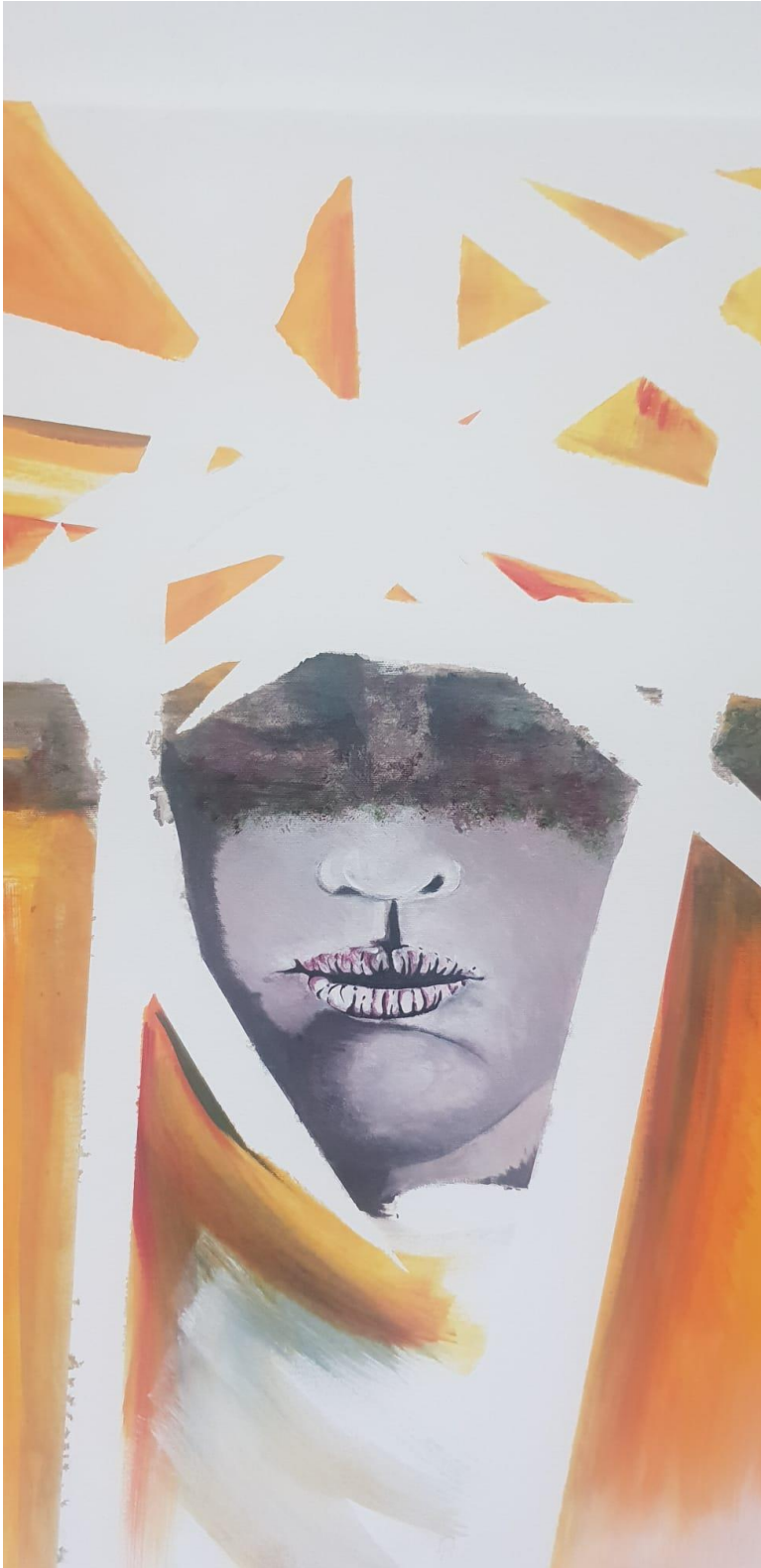
IMAGEN ORIGINAL Y CUADRO CREADO POR MERCEDES NARANJO