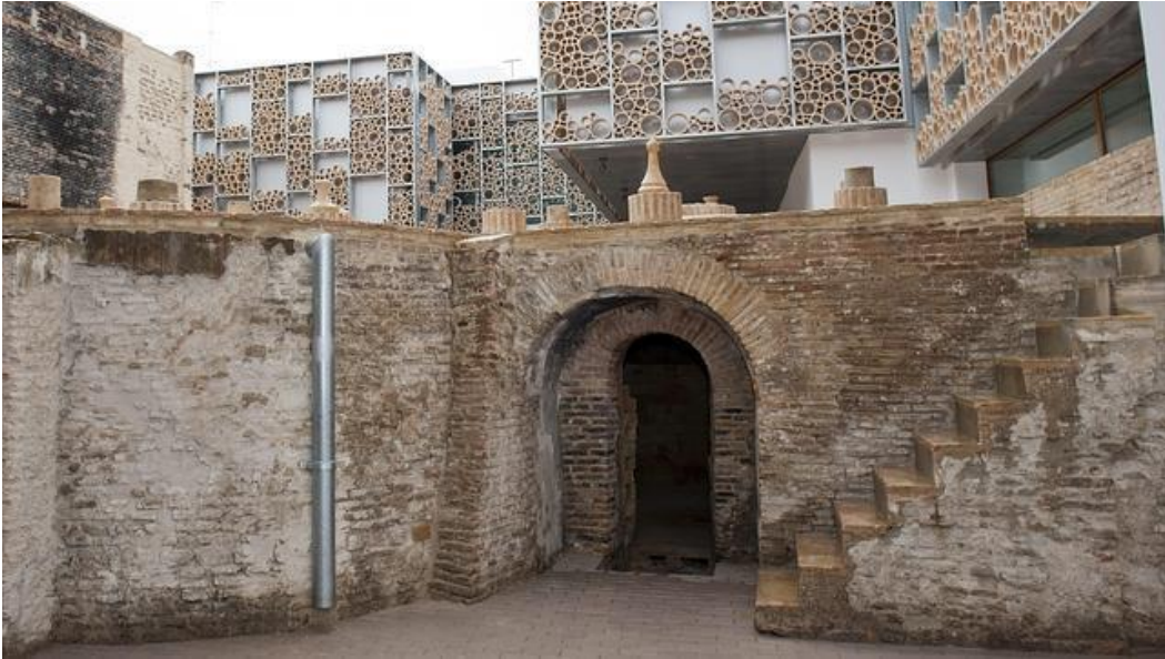
Foto: Horno de cerámica de la antigua fábrica de Santa Ana, hoy Centro Cerámica Triana.

Red CARPET open tour hace escala en este centro que conserva hornos de cerámica de la antigua fábrica de Santa Ana, como el que se puede apreciar en la entrada. Igualmente, se pueden ver almágenas , palabra de origen árabe que designaba unos recipientes para guardar los pigmentos preparados. Red CARPET propone con esta visita una introducción a un momento histórico en la producción de la cerámica en la ciudad de Sevilla. No obstante, no se incluirá el recorrido completo del centro pero resultará un impulso maravilloso para animar a que las personas que aún no lo conocen puedan dedicarle el tiempo que merece en otro momento. El Centro Cerámica Triana posee una colección permanente fabulosa de piezas cerámicas datadas desde la Edad Media hasta el siglo XX, escrupulosamente seleccionadas por expertos a partir de distintas colecciones. Así mismo posee un interesante programa de exposiciones temporales, conferencias y otros eventos, así como un espacio destinado a conocer mejor el barrio de Triana.