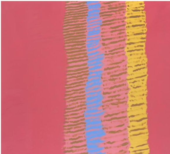
Wallpaper n. 1. Acrílico sobre lienzo, 200 x 220 cm

Pintura. Calle Virgen del Buen Aire, Torre 3 bajo