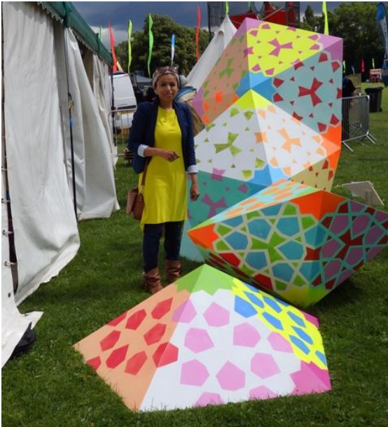
SABA RIFAT (Manchester, Inglaterra)